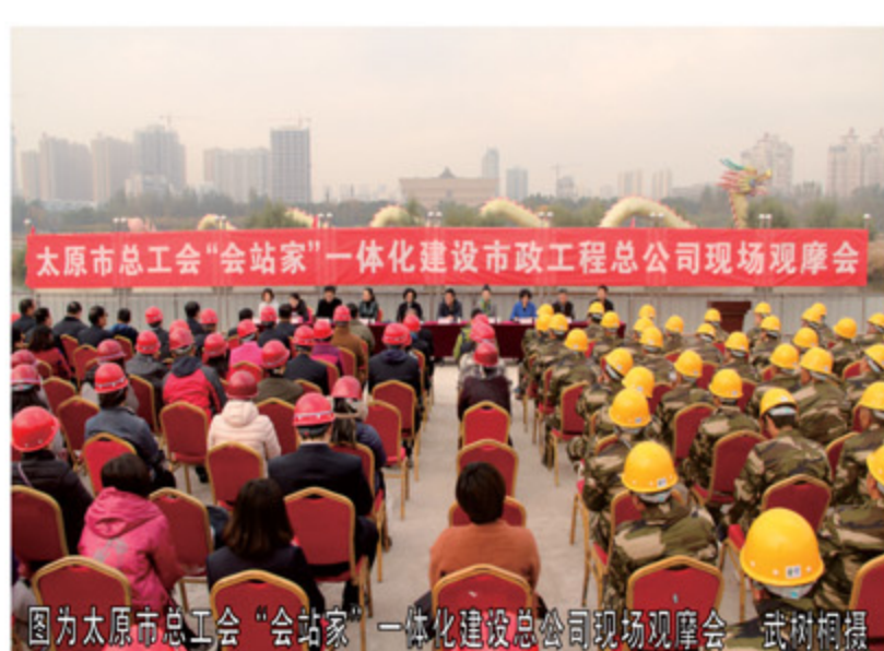
图为太原市总工会“会站家”一体化建设总公司现场观摩会

本报讯 10月31日上午9时，太原市总工会“会站家”一体化建设总公司现场观摩会在水西关泵站隆重举行。