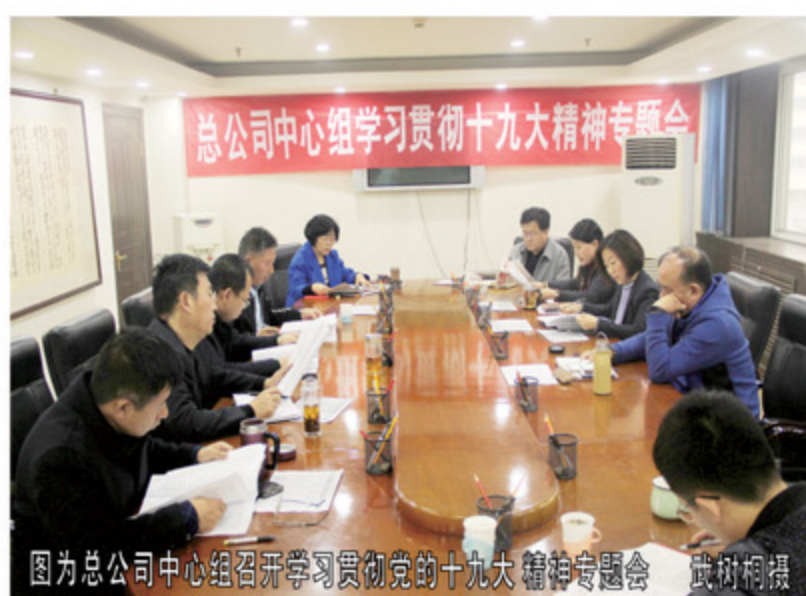
图为总公司中心组召开学习贯彻党的十九大精神专题会